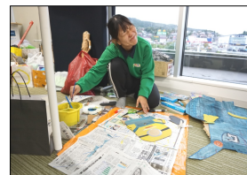
先生たちも仮装頑張りました