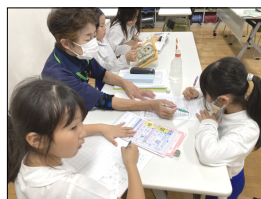
先生と一緒に 100点目指して頑張ろう!