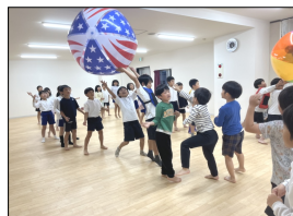
いっぱい動いて、寒さもへっちゃら