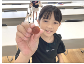
普段のお菓子も大好き!