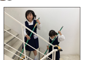
毎日お掃除ありがとう