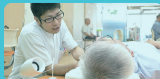
リハビリ特化型デイサービス ユーフィット様