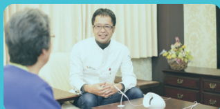
在宅医療 やまぐちクリニック 様