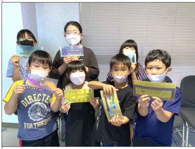
完成したマスクケースとパシヤリ★

10月1日は7人のお友達に来てくれました！いつもは3〜4人なので、この日は人数が多くてすごく賑やかでしたよ！ 午前中は掃除を手伝ってもら