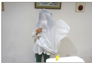
あれ？頭が入らない…

10月27日のオフション英語のハロウィンパーティーに向けて衣装の制作を行いました。今年もビニール袋を衣装に仕立てて仮装をします。 そのため、まずはビニール袋に頭と腕を出すための穴をあけました。試しかぶってみます。