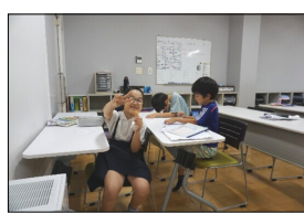
お菓子片手にピース