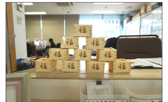
ペーパークラフトで升を作りました!