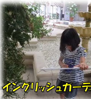
イングリッシュガーデン